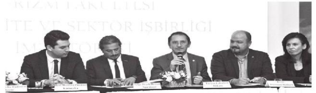
Sektörün önde gelen otelleri, turizm acentaları, restoranlarının temsilcilerinin katıldığı "Üniversite Sektör İşbirliği İyi Niyet Protokolü"ne göre taraflar, akademik ve sektörel deneyimlerini birbirlerine aktararak, öğrencilerin iş ve staj olanakları konusunda paylaşımda bulunacak.