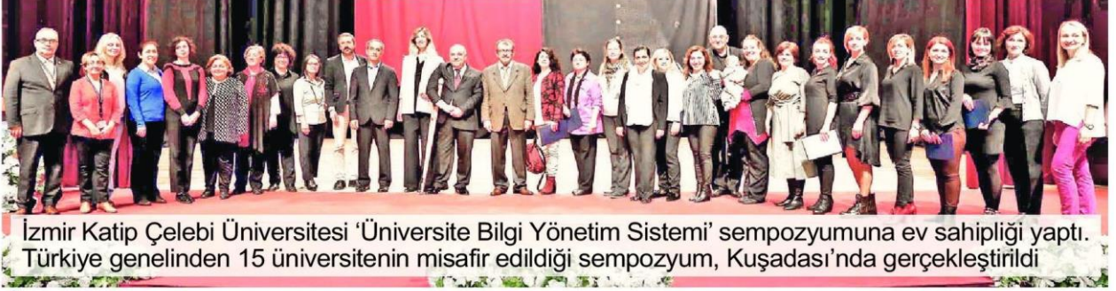
Izmir Katip Çelebi Üniversitesi 'Üniversite Bilgi Yönetim Sistemi' sempozyumuna ev sahipliği yaptı. Türkiye genelinden 15 üniversitenin misafiri edildiği sempozyum, Kuşadası'nda gerçekleştirildi