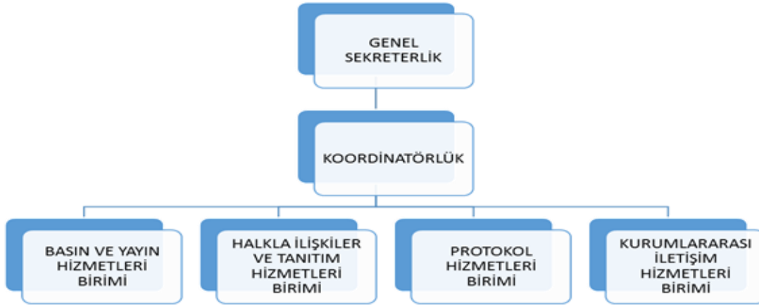
Şema.1: Organizasyon Şeması